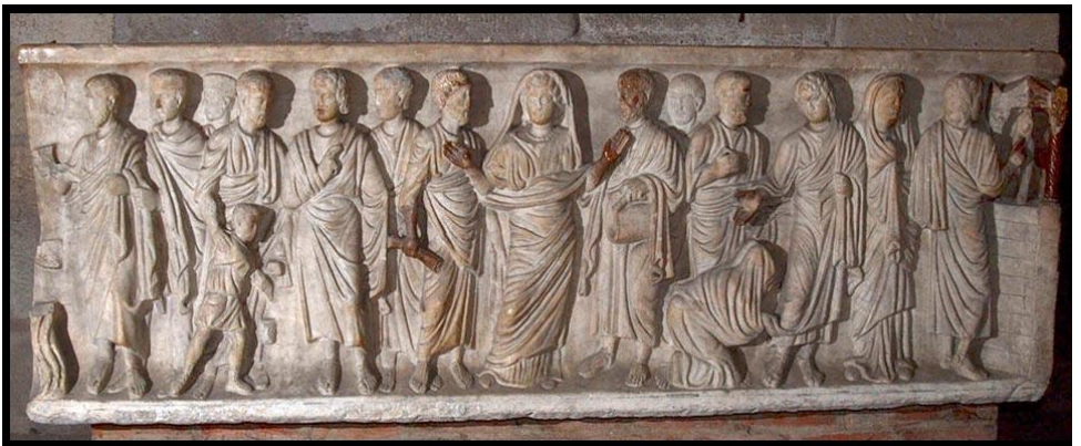
sarcophage dans la crypte

Viollet-le-Duc, au XIX e siècle, reprend et achève l'architecture du Moyen-Age en construisant les 2 dernières travées de la nef et le porche en style néogothique.