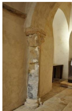
colonne soutenant le chœur