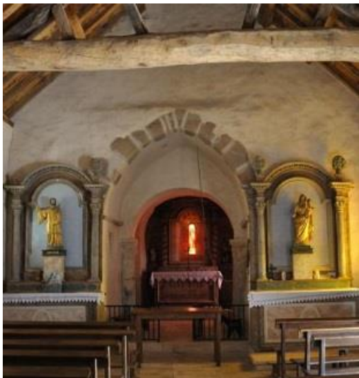
la nef et le chœur