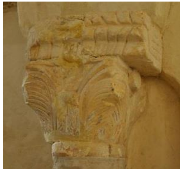
2 chapiteaux anciens