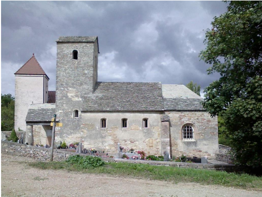
Vue de l'église côté sud, chevet, nef, clocher et auvent